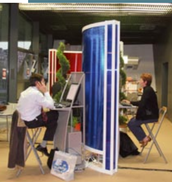
Le Cyber espace : pour découvrir le programme Qualité en ligne et... consulter vos e-mails.

nationale, l'Union nationale des étudiants en chirurgie dentaire... Vous pourrez aussi échanger avec les responsables de Bibliodent, la banque de données francophone en odontostomatologie sur Internet.